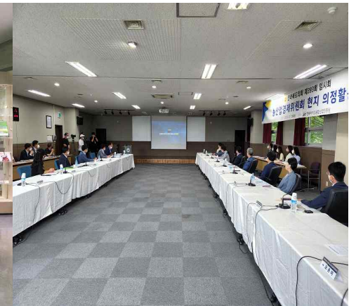
<주요 현안 청취>