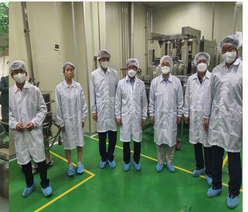
<GMP 생산공장 시찰>