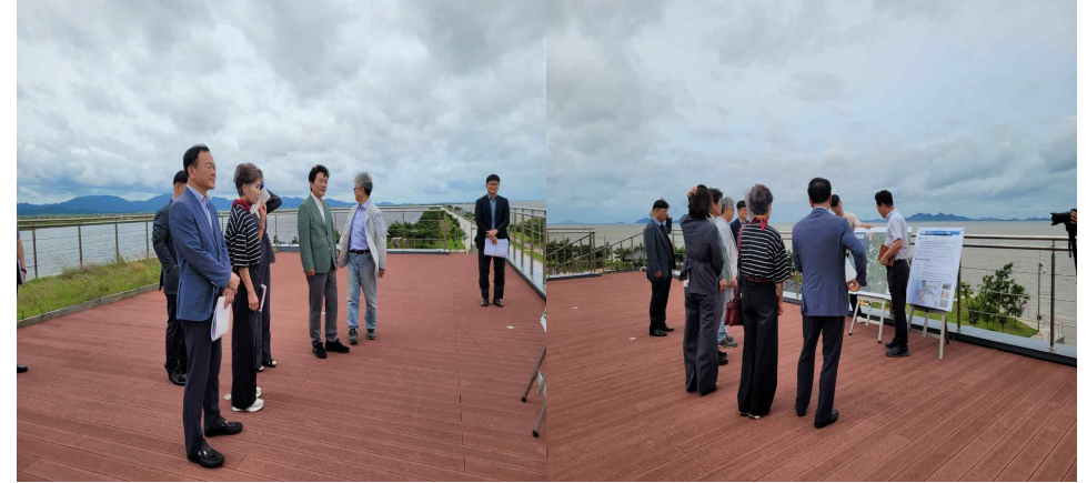
<새만금 농생명용지 현지 시찰>