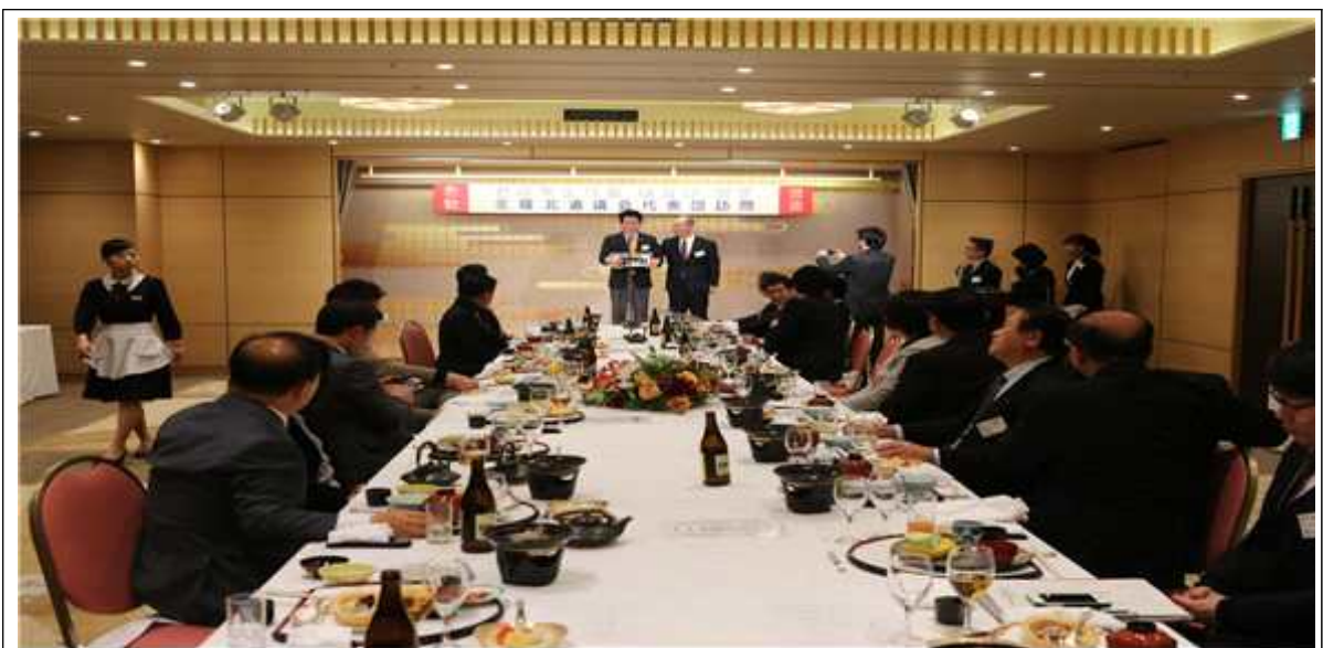
《 가고시마현의회 의장 주관 만찬 》