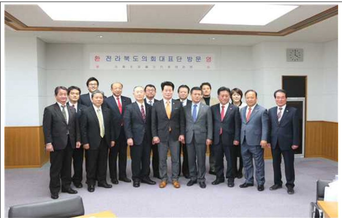
《 간담회 후 기념촬영 》