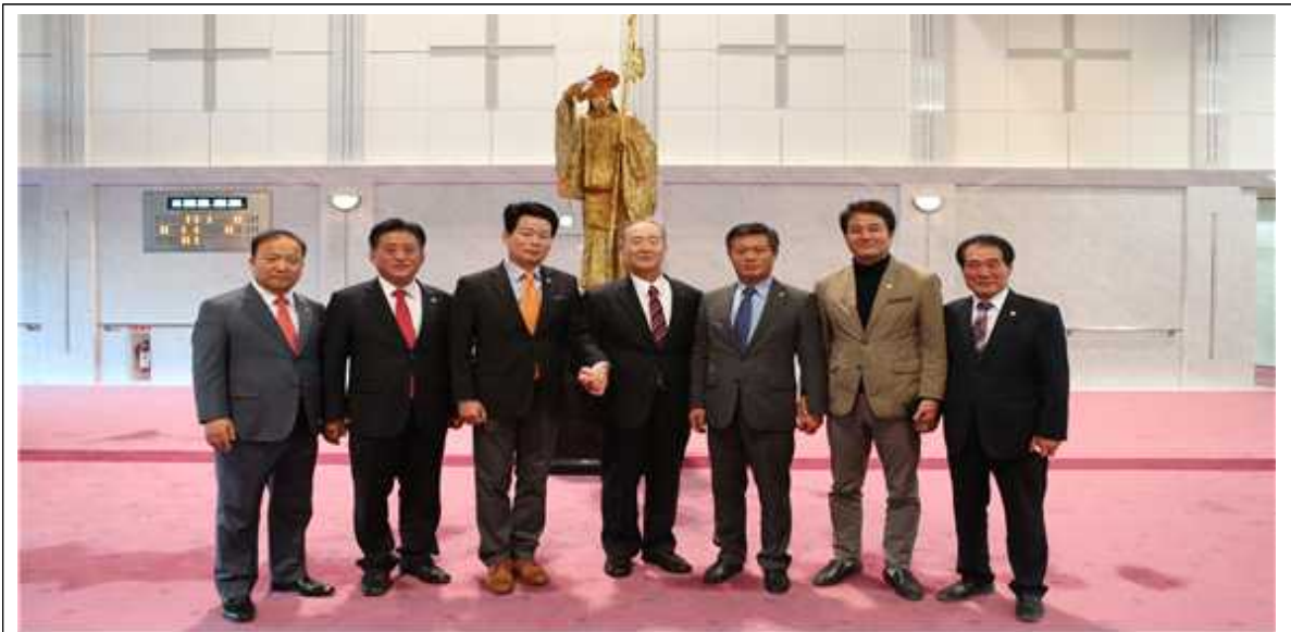
《 가고시마현 의회 청사 시찰 》