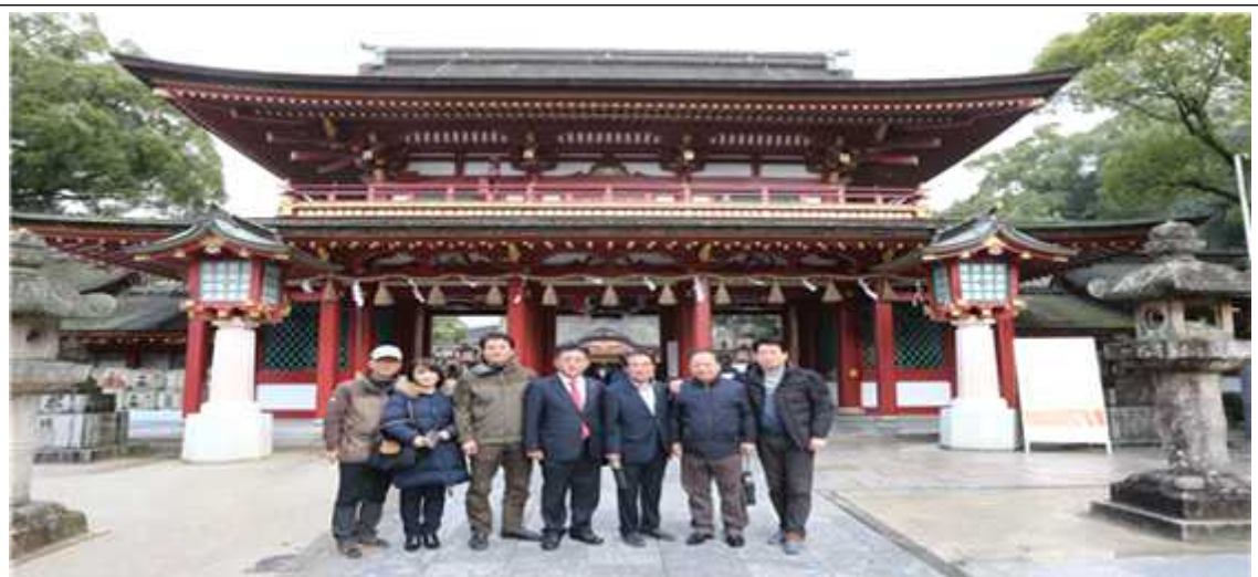
《 태자부 천만궁 방문 》