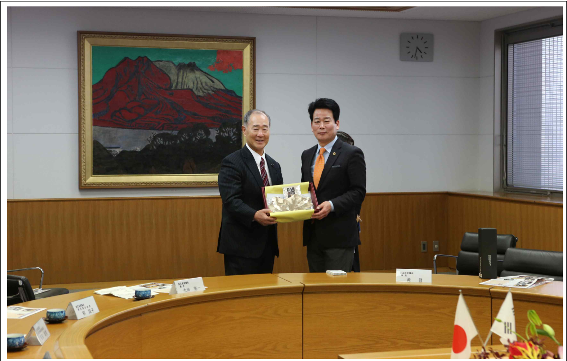
《 기념품 교환 》