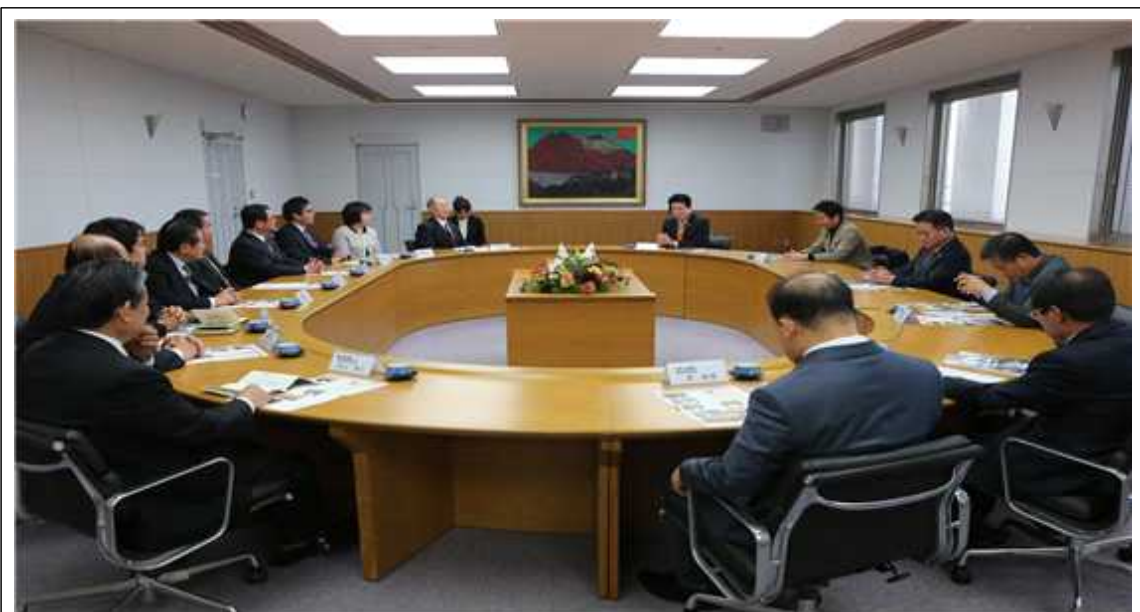
《 가고시마현의회 의장 예방 》