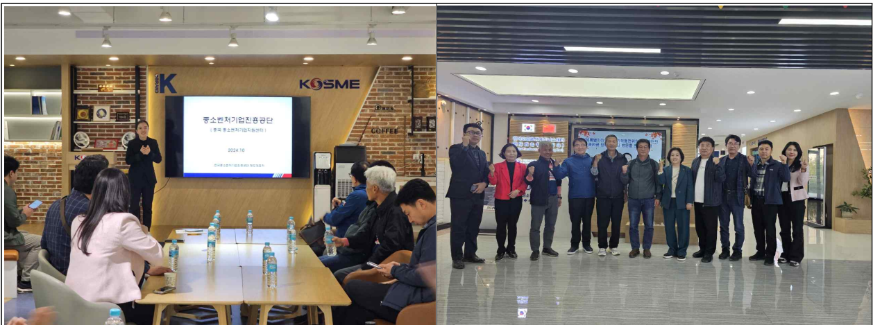
칭다오 중진공 글로벌비즈니스센터 현황 설명 및 질의응답