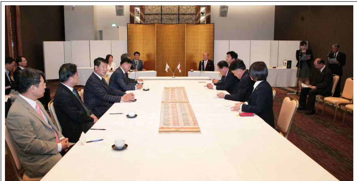
《이시카와현의회 의장 면담》