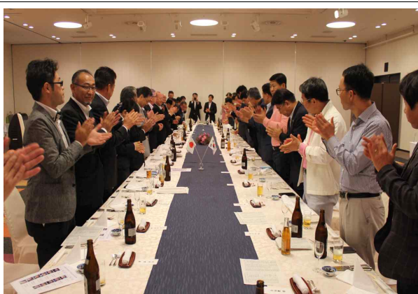
《이시카와현 경제인 간담 만찬》