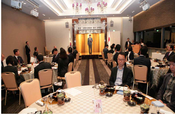
《이시카와현의회 의장 환영 만찬》