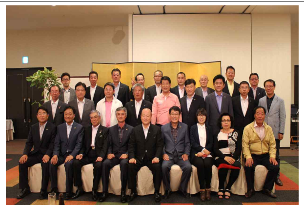
《간담 만찬 기념》